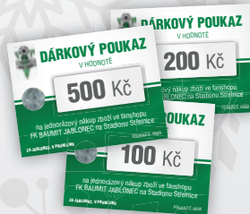
Dárkové poukazy 100 Kč, 200 Kč a 500 Kč

* Sleva 20 % na vánoční balíčky neplatí pro permanenkáře. Ti si mohou zakoupit zboží se svojí standardní slevou.