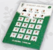
Adventní kalendář mléčná čokoláda