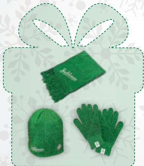
Zimní balíček kulich, šála a rukavice