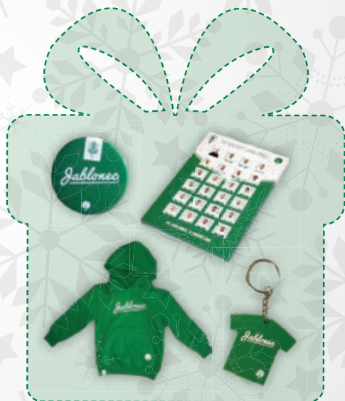
Dětský balíček mikina, adventní kalendář, placka, přívěšek